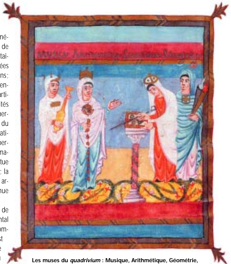
Les muses du quadrivium : Musique, Arithmétique, Géométrie, Astronomie

La constatation et la question qui se trouvent au cœur de la réflexion des mathématiciens sont les suivantes : « La documentation est pour nous, producteurs et utilisateurs de contenu, un enjeu