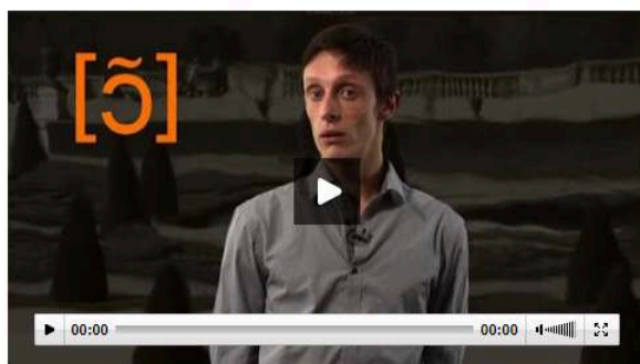
Figure 1 – Capture d'écran d'activités proposées dans le cadre des "mémos phonétiques" sur le site TV5 Monde.

partie présentation de modèles/répétitions des modèles en question. Ce type de ressources est particulièrement apprécié et utile pour l'enseignement en contexte exolingue où les modèles phonatoires proposés à l'apprenant peuvent être limités. Ils peuvent aussi constituer une précieuse aide en matière d'autoformation pour l'enseignant en cas de besoin.