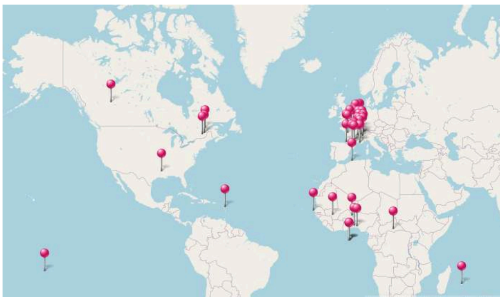
Figure 5 – Points de collecte de données orales dans le projet IPFC (source : https://research.projet-pfc.net/index.php ).