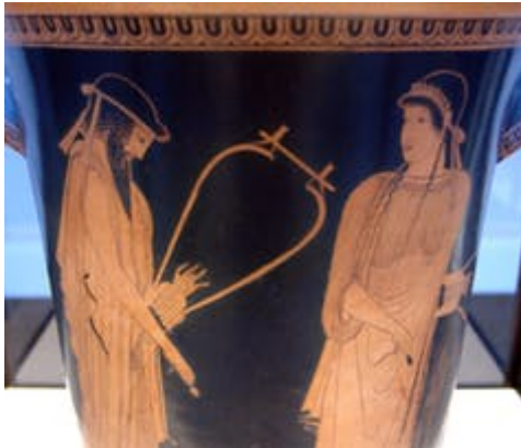
Alcée et Sappho, kalathos attique à figures rouges, v. 470 av. J.-C. Staatlichz Antikensammlungen, Inv. 2416.

Chez Homère, les caractéristiques principales de l'oralité résident dans les catalogues, les listes généalogiques, les scènes typiques et les formules, les comparaisons et plus généralement ce que l'on appelait en grec σήματα (sēmata « signes »)- du mot qui a donné pour nous tout le vocabulaire lié à la sémantique et la sémiologie.