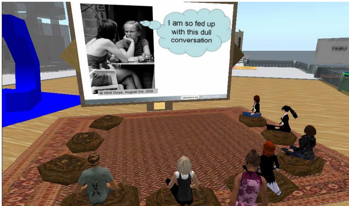
Figure 1 – Interaction en grand groupe.

La séance a débuté par une explication de la responsable sur le plan du cours. Ensuite, l'enseignant a pris le relais et a aidé les apprenants à s'exprimer avec des formules de politesse dans des situations illustrées par des images comme changer le sujet de discussion ou refuser une invitation. Le mode alternatif de communication - à voix haute et clavardage - a été employé par les participants.