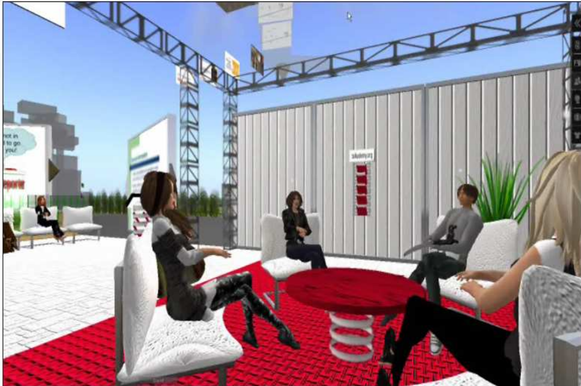
Figure 2 – Interaction avec la comédienne native.