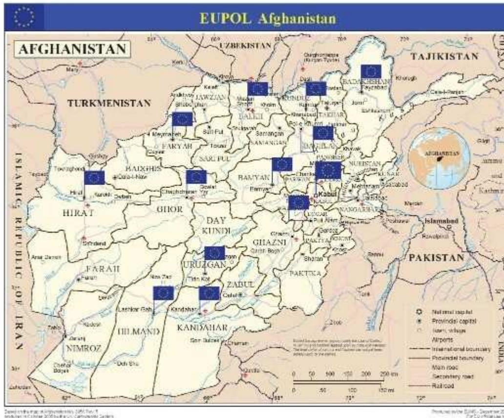
Carte 5 : Carte de déploiement de la mission EUPOL Afghanistan 33

internationaux issus de 23 Etats européens et de 176 personnels locaux, pour un budget de 58 millions d'euros en 2015 32 .