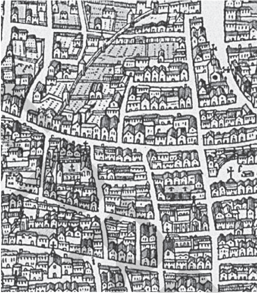
Fig. 3 – Les parcelles locatives des Blancs-Manteaux en lisière de leur îlot. Arch. nat., NIV Seine 14

(ensuite connue comme rue des Billettes et, de nos jours, rue des Archives) ; en 1344, les religieux obtinrent une autre maison dans la même rue 17 . Entre 1366 et 1368, les chanoines acquirent une troisième maison au chevet de leur église. En 1545, les chanoines héritèrent d'une maison proche de la porte Saint-Jacques et de deux maisons jumelées rue de Bussy. En 1608, les chanoines reçurent, en forme de don, une maison sise rue de la Verrerie. En 1666, les chanoines acquirent une grande maison sise rue Sainte-Croix-de-la-Bretonnerie au prix de 100 000 livres. Or, elle aurait pu être qualifiée d'« hôtel » tant par sa superficie (241 toises carrées) que par sa valeur locative (6 400 livres en 1790) 18 . Somme toute, au moment de l'estimation des biens nationaux, la régie des biens du prieuré détenait un parc locatif qui comprenait deux immeubles locatifs sis rue Sainte-Croix-de-la-Bretonnerie, trois immeubles rue des Billettes, un immeuble rue de la Verrerie (cette maison était occupée par l'étude notariale portant la cote LIV de nos jours), un autre immeuble rue des Nonnains-D'Hyères, une maison rue de la Tableterie et deux maisons contiguës rue de Bussy, soit dix immeubles, dont six situés aux abords du cloître.