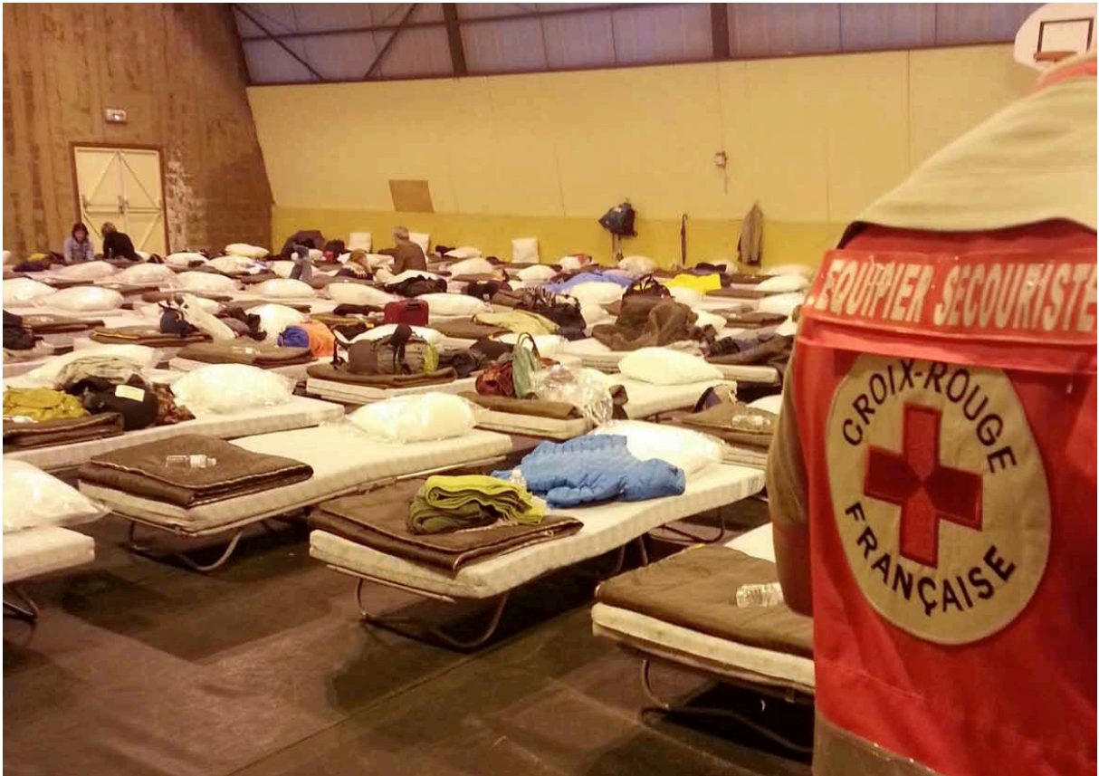
Foto.4: Jour inondable: La ville boît la tasse.

Após esta breve apresentação, vamos analisar o modo de funcionamento deste dispositivo. A inundação fictícia do Loire é uma simulação sofisticada: uma mistura de experiência sensível, de ficção, de risco e de realidade objetiva. Este dispositivo procura ultrapassar duas armadilhas. Em primeiro lugar, de uma simulação baseada em uma mera comunicação racional que, frequentemente, é considerada como uma mera formalidade e, portanto, incapaz de envolver as pessoas em causa. Outra, de uma simulação que envolve pura fantasia e desprovida de elementos da realidade. Jour inondable é uma ficção que incorpora as informações fornecidas pelos profissionais das inundações e de todas as pessoas da cidade de Tours que têm uma interação com o rio Loire. A capacidade artística recria uma "ambiência de risco de inundação" a fim de que as pessoas façam a experiência sensível e imaginária de um risco (o que é paradoxal, porque o risco é algo intangível, é a probabilidade de ocorrência de um perigo). O dispositivo estético promove o engajamento corporal do público, estimula a sua imaginação criativa e a sua capacidade para representar o evento catastrófico. A imaginação ajuda a sensibilizar a população exposta, ou seja, ela torna o risco mais perceptível e essa população será mais sensível, mais fácil de se sensibilizar e agir à catástrofe, caso ela ocorra.