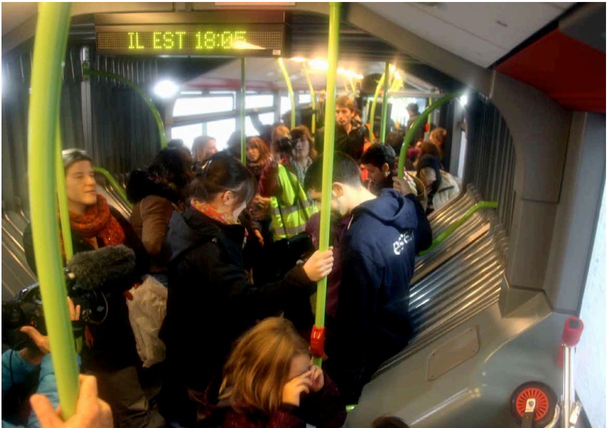
Foto.3: Jour inondable: Le concert de sirènes.

A cidade se afoga (la ville boît la tasse) . Tours é inundada. O ônibus levou o grupo ao ginásio Montaigne, localizado em Tours Norte, onde eles passam a noite. O ginásio é localizado nas colinas, em zona não inundável, local que de fato seria requisitado em caso de inundação. A parceria com a defesa civil da cidade de Tours permitiu uma simulação muito realista, com todos os equipamentos de alojamento e emergência. A refeição liofilizada é uma refeição compartilhada por todos em grandes mesas, com uma ambiência de cantina. Após a refeição, à noite, os participantes assistem ao documentário de Spike Lee When the levees broke sobre o furacão Katrina em Nova Orleans. O filme permite imaginar com uma grande precisão a dimensão realmente trágica do desastre, mostrando, por exemplo, cadáveres que flutuam na água. Em seguida, os participantes vão dormir na grande sala do ginásio convertida em dormitório.