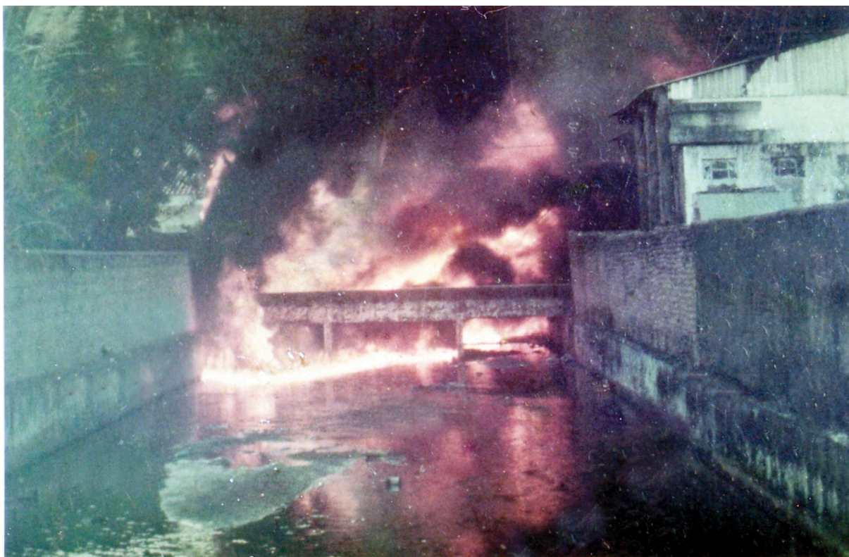
Foto.2: Incêndio do Córrego de Outeiro.