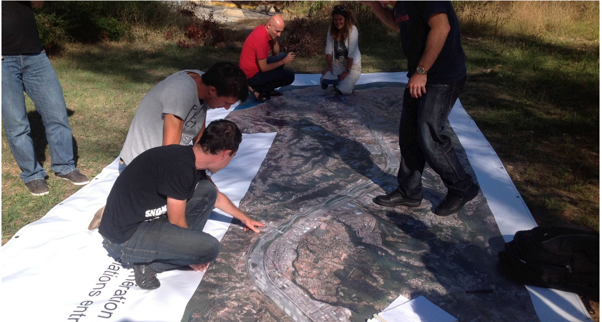
Foto.7: Quarta-feira, 18 de setembro de 2013, o dispositivo é testado em frente ao laboratório Géoazur.

Como funciona este método? Não é possível restituir precisamente a experiência vivida pelos moradores, mas com este dispositivo os participantes reativam uma parte desta experiência. A fotografia aérea permite esta reativação, pois a alta precisão da representação fotográfica, em larga escala, da bacia do Vallée du Var fornece uma grande quantidade de detalhes que ilustra algumas das características do território. Esses detalhes são usados como “gatilhos de memória ( embrayeurs de mémoire ) que provocam a memória, por associação e expansão de lembranças do essencial da experiência vivida” (J. Arrouye, 2002). Enquanto ele é centrado em uma fotografia, o dispositivo tende a reduzir a principal limitação do meio fotográfico “seu modo de gravação frontal e fixo do espetáculo visual” (idem). De fato, na medida em que engaja uma implicação corporal dos participantes, os gestos dos atores envolvidos no dispositivo chama uma memória ampliada da experiência vivida além de meras referências visuais. A participação corporal dos participantes exerce-se em várias sequências sucessivas: