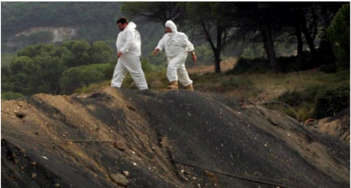
Foto.5: Salsigne fechou fica um dos sítios mais poluído na França.