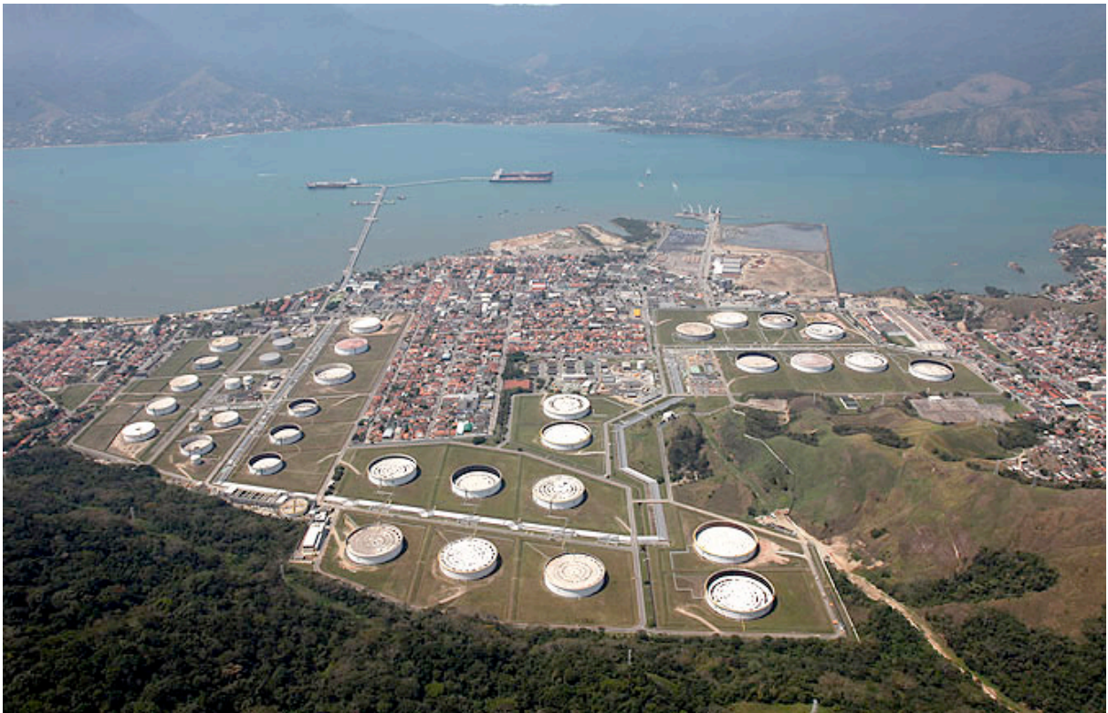
Foto.1: Terminal Marítimo Almirante Barroso - Tebar.

Entre os muitos acidentes que já ocorreram, dois marcaram profundamente a cidade. Um deles aconteceu em dezembro de 1991, quando ocorre uma explosão e um incêndio do petroleiro Alina P, no Canal de São Sebastião, uma passagem marinha com 25 km de comprimento, 2 a 7 km de largura e 40m de profundidade máxima. Outro acidente, considerado o mais grave, foi o incêndio que ocorreu do Córrego de Outeiro, em 06 de abril de 1984. Esse córrego passa pelas instalações da empresa e pelo centro da cidade, até desaguar no mar. Em relação a esse acidente, tudo começou com o transbordamento de um dos diques de contenção do terminal de petróleo de São Sebastião, o qual veio atingir o Córrego do Outeiro. A mancha de óleo pegou fogo e as chamas de dez metros de altura “corriam” pelo córrego, passando pelo centro da cidade até chegar no canal de São Sebastião, causando uma maré negra. O evento gerou muito pânico na população, provocou o congestionamento das estradas, deixou a cidade sem eletricidade, sem telefone e sem água, e provocou uma vítima fatal (J. M. Platon, 2010, I. Poffo, 2011).