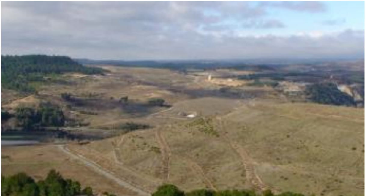
Foto.6: Colinas artificiais feitas do minério processado na Unidade de Combe du Saut : a polpa de minério é carregada com arsênico e cianeto. Abaixo, fluindo, o rio Orbiel.

No local, o debate foi muito intenso, entre os partidários e os opositores do fechamento da mina. Havia forte tensão entre a população submetida à poluição (principalmente os agricultores aposentados) que já não podiam mais cultivar a terra, e os mineradores cuja mina era seu meio de subsistência e cujo problema era como sobreviver sem morrer por conta da contaminação. A situação era explosiva. A ameaça de um conflito violento veio à tona quando grandes caminhões dos mineradores faziam face aos os agricultores com fuzis. Assim, um grupo de pesquisadores, sociólogos e geógrafos, comprometeu-se a ajudar para acalmar e esclarecer a situação. Eles organizaram e animaram um seminário de três dias com todas as partes envolvidas no problema. Cada grupo de atores poderia falar sem ser interrompido durante uma sessão e ante dos outros grupos que, por sua vez, falariam nas sessões subsequentes. As transcrições desses seminários foram examinadas e validadas pelos grupos concernidos, e estão disponíveis ao público.