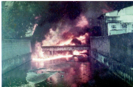
Fot. 2 - Incêndio do Córrego de Outeiro.

altura “corriam” pelo córrego, passando pelo centro da cidade até chegar no canal de São Sebastião, causando uma maré negra. O evento gerou muito pânico na população, provocou o congestionamento das estradas, deixou a cidade sem eletricidade, sem telefone e sem água, e provocou uma vítima fatal (J. M. Platon, 2010, I. Poffo, 2011).