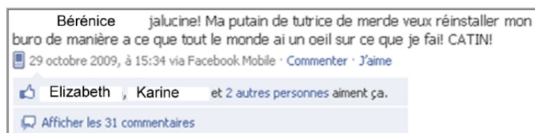
Illustration n°2 : Message publié par Bérénice

Les messages se répartissent également entre les sphères privée et professionnelle. Cependant, pour cette dernière, il s'agit très largement de se plaindre des conditions de travail. Nous retrouvons dans cette autocritique le « facework » ou gestion des faces des interactants et notamment un Face Threatening Act , caractéristique de la communication affective (FTA, Brown et Levinson : 1987 ; repris par F. Martin-Juchat : 2008).