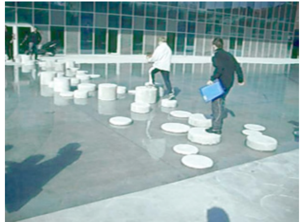
Figure 2: Une place pour trois quartiers - Projet Djamel Klouche et Jan Kopp suite à l'étude BazarUrbain.

La parole individuelle est ainsi multipliée par celle des autres et devient polyglotte, l'expérience se partage, la connaissance du lieu se construit par petites touches qui seront affinées par d'autres approches.