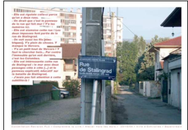
Figure 3: Lecture des tissus urbains d'Echirolles par ses habitants.

Cela implique de réfléchir au renouvellement, à la substitution permanente des éléments sans altération de la cohérence et de l'efficacité de l'ensemble. Travailler enfin sur les tissus urbains, c'est reconnaître que plusieurs tissus coexistent côte à côte dans la ville et forment, en théorie, un tout. Cela oblige à se poser en permanence la question du tissage des liens entre des tissus urbains d'époque ou de natures différentes.