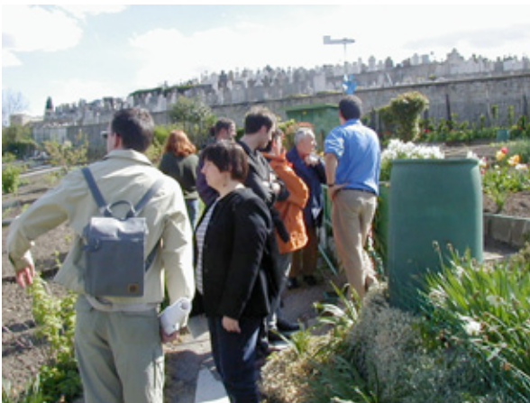
Figure 1: Parcours commentés – Saint-Etienne.

Le «récit situé» est ainsi une parole descriptive du lieu et de ses usages, délivrée sur place et qui, de ce fait, permet de confronter un discours de représentation à la «réalité» du terrain. Le «récit partagé», mené en groupe sur le terrain, permet d'introduire le temps, le corps et les usages dans les situations vécues. Il apporte aussi une prise de conscience des représentations individuelles et collectives et permet de poser les bases d'une expérience commune.