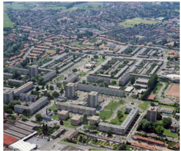
Figure 6: Quartier des Hauts-Champs avant rénovation.

Le quartier des Hauts Champs est constitué d'îlots de maisons en bandes appartenant principalement au bailleur social Logicil (Groupe CMH). Il est situé à Hem dans le nord de la France. En cœurs d'îlot, plus de 400 garages ont été construits définissant des espace clos, minéraux et en cul-de-sac. Ces garages délabrés, indépendants des maisons, ils servent parfois à des activités illicites. Leur positionnement a contribué à développer un sentiment d'insécurité, renforcé progressivement par la vacance des garages.