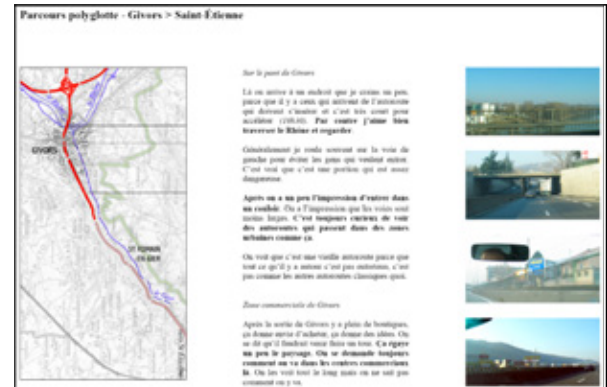
Figure 4: Parcours embarqués et cartes mentales