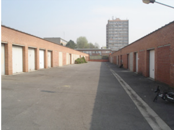
Figure 7: Coeur d'îlot.

- Un principe d'implication : mettre en place un processus qui implique et rend possible l'expression et l'écoute des trois maîtrises : maîtrise d'ouvrage – maîtrise d'œuvre – maîtrise d'usage