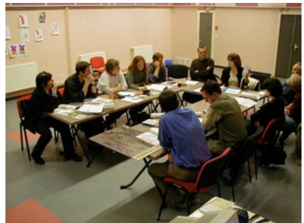
Figure 5: Atelier de travail multi-acteurs. Ville de Saint-Etienne.

En appeler comme nous le faisons à croiser les regards des maîtrises ou des disciplines conduit à s'interroger sur des principes d'hybridation. La notion d'ambiance architecturale et urbaine, forgée dans la recherche, permet de franchir ce pas.