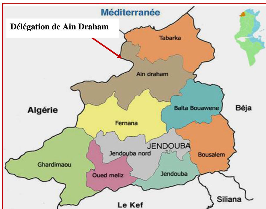
Figure 1. Localisation de Ain Draham dans le gouvernorat de Jendouba

La délégation d'Ain Draham appartenant au gouvernorat de Jendouba fait partie de cette région et est considérée par nombreuses études comme étant une zone difficile. Les dernières statistiques le prouvent, Ain Draham est classée 258 sur un total de 264 délégations en Tunisie selon l'indicateur de développement régional calculé en 2012 par le ministère de développement régional et de la planification.