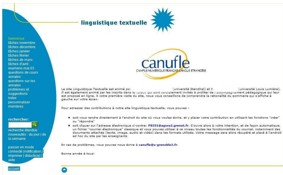
Annexe 1 : Entrée dans un cours de Quickplace