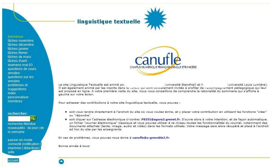
Annexe 1 : Entrée dans un cours de Quickplace