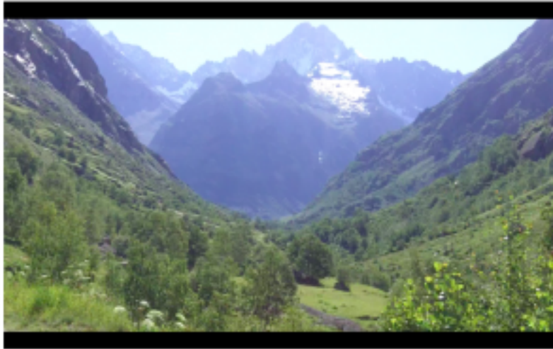
Figure 3 : Sur la route menant à la Bérarde. Photogramme issu des notes de terrain filmées.

Cette relation avec l'environnement, aussi frontale et saisissante soit-elle lorsqu'on arrive dans les lieux, peut être vécue au quotidien selon des modalités diverses et solliciter différentes échelles. Celles-ci orientent les éléments de réponses aux questions que nous nous posons à l'origine de ce projet, à savoir : Qu'entend-on lorsqu'on est en présence du Vénéon ? Peut-on parler du bruit (ou du son) entendu et de son écoute ? Et comment, lorsqu'on habite la vallée, en parle-t-on ? Le texte à paraître d'Anthony Pecqueux (Cf : " Lire le torrent et "l'entendre comme" une berceuse – billet LCV à paraître), en traçant certaines figures de "lecteurs du torrent", fait l'hypothèse d'une écoute et d'une parole liées à une appréhension synesthésique et configurées par les pratiques et les rapports que ces "lecteurs" entretiennent avec le Vénéon. Il relève, à la suite de David Abram , différents modes de perception-participation de l'organisme à son environnement. En allant dans le même sens, je souhaiterais proposer ici quelques rapides remarques liées, d'une part, au mode d'engagement à partir duquel le corps est en relation avec l'environnement et, d'autre part, à l'échelle des objets d'écoute (ou plus globalement des objets de perception et d'attention) qui en découle.