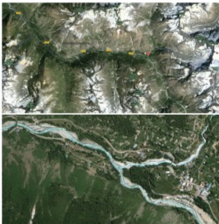
Figures 1 et 2 : Photographies aériennes sur lesquelles on identifie l'extrémité Sud de la route départementale 530 qui prend fin à la Bérarde, dernier village de la vallée du Vénéon. Le torrent éponyme prend naissance dans un glacier situé quelques kilomètres en amont.

Si c'est d'abord visuellement que l'environnement se révèle lorsqu'on est dans cette vallée de haute montagne, il se manifeste de manière tout aussi franche par d'autres biais. Ici tout le système sensoriel et ses différentes modalités se trouvent stimulés de façon amplifiée. La peau est en contact avec des températures basses, avec le soleil – qui, se levant plus tard et tombant plus rapidement derrière les massifs montagneux, se trouve aussi plus brûlant à cette altitude (la couche atmosphérique filtrant moins les UV) et réverbéré par les surfaces enneigées –, avec le vent, la neige, la pluie... Se déplacer à pied sur le sol accidenté et rarement plat sollicite les muscles, les tendons, les os et les articulations, c'est-à-dire plus globalement l'ensemble des propriétés proprioceptives et kinesthésiques de l'organisme. Et concernant la dimension sonore, si l'écho du tonnerre renvoyé par les multiples parois s'abat au rythme des orages, c'est de façon quasi-constante (à part au plus froid de l'hiver) que le son de l'eau qui coule (Vénéon, cascades et autres affluents du torrent) enveloppe inlassablement le visiteur d'un « grondement puissant & continu » (d'après l'expression de juL McOisans dans Une infinité de nuances de bruits colorés ).