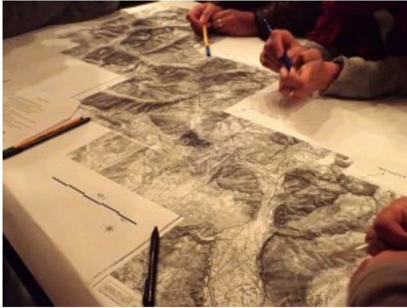
Figure 6 : Séance in vitro : entretien collectif sur écoute réactivée, à la Cordée, Saint-Christophe-en-Oisans.

La connaissance et la mémoire des lieux se sont révélées être des éléments primordiaux de l'écoute et des échanges lors de l'entretien collectif sur écoute réactivée initié par Thomas Geay, l'un des hydrologues de l'équipe et mené en novembre 2014 à La Cordée , point névralgique de la vie de la vallée. Cet entretien – séance in vitro qui a eu lieu à la suite d'une première enquête qualitative in vivo – a réuni huit habitués de la vallée (habitants ou personnes ayant un rapport quasi-quotidien aux lieux car y pratiquant une activité professionnelle). Ces participants étaient invités à réagir à la diffusion de plusieurs séquences sonores composées d'enregistrements réalisés principalement (mais non exclusivement) sur les rives ou à proximité du Vénéon. Au cours de ces exercices d'écoute nous avons pu remarquer que les participants étaient attentifs à des indices sonores permettant de spatialiser plus facilement la scène entendue. Ainsi, l'écoute de chants d'oiseaux (dont la présence renvoie à celle d'arbres) associés à une certaine intensité de la puissance de l'eau, permet à l'auditeur qui connaît la vallée de déterminer un ensemble de lieux d'enregistrement possibles répondant aux caractéristiques sonores entendues.