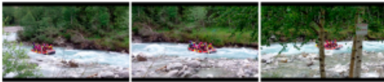
Figure 5 : Rafting sur le Vénéon. Photogrammes issus des notes de terrain filmées.

– Le premier se caractérise par une forme de fixité et de distance : l’observateur considère le cadre environnant à travers l’idée de paysage moderne, en prenant le parti d’un rapport esthétique et distancié à l’environnement. L’environnement est alors appréhendé dans sa globalité, c’est-à-dire au travers d’une échelle large qui permet de penser l’espace comme composé d’entités identifiables importantes mais cependant peu détaillées et dont les contours demeurent assez flous. Il s’agit ainsi de l’échelle du cadre paysager dans lequel s’inscrit le Vénéon comme torrent distinguable (avec une source, un aval et un amont, une rive droite et une rive gauche). Dans ce mode d’engagement, la montagne est considérée en premier lieu comme un « décor » [1] que l’on peut savourer (« c’est un petit paradis ici »). À cette échelle, la vue du Vénéon, de la « trajectoire de cette eau bleue, turquoise, translucide », est alors considérée comme « un régal visuel, esthétique ».