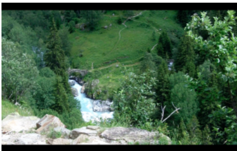
Figure 4 : Le pont "romain" (Pont de la Lavey et la Raja). Photogramme issu des notes de terrain filmées.

Il me semble que nous pouvons relever deux modes d'engagement principaux dans le rapport à la vallée et , plus spécifiquement, dans la relation au Vénéon :